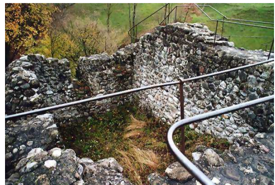
Ruinen der Gessler – Burg in Küssnacht

Der folgende König, Heinrich VII. (1308-1313) von Luxemburg, ein Rivale der Habsburger, bestätigte nicht nur die Reichsunmittelbarkeit von Uri und Schwyz, sondern gab auch Unterwalden das gleiche Recht (1309). Nach seiner Regierung kam Ludwig IV. der Bayer (1314-1347) an die Macht, womit die Eidgenossen vorerst gesichert schienen gegen eine königliche Intervention der Habsburger. Da brach Herzog Leopold von Österreich 1315 mit einem Ritterheer ein, um sich die Waldstätte endgültig für das Haus Habsburg zu unterwerfen.