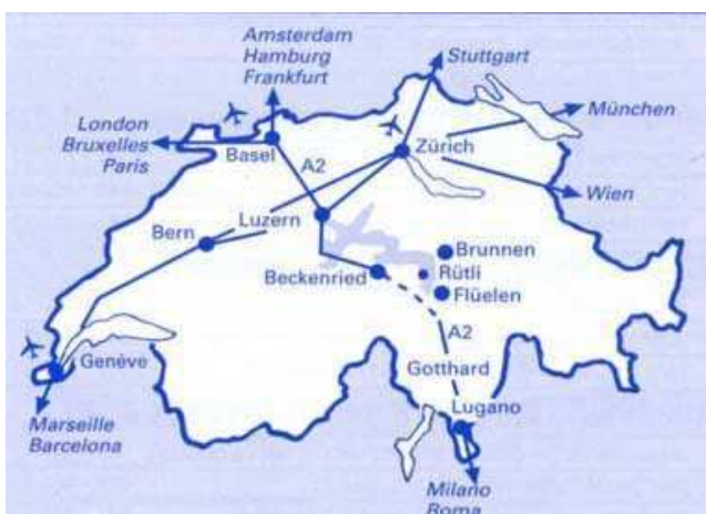
Orthographische Verhältnisse der Schweiz

Luzern, Zürich, Glarus, Bern und Zug ; bekannt als die achttörtige