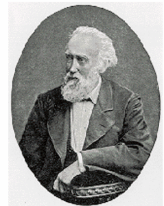
THEODOR STORM (1817-1888)

kritik verlangt eine realistische Dichtung. Von realistischer Dichtung spricht man üblicherweise dann, wenn die Schriftsteller ihr Interesse dem Alltäglichen zuwenden, um es ernsthaft, umfassend und ohne subjektive Kommentare zu beschreiben, so dass die Darstellung den Vergleich mit der historischen Wirklichkeit herausfordert. Man trennte den einzelnen klar von der ihn umgebenden Objektsphäre. Nur letztere (=Wirklichkeit) sollte gezeigt werden. Zum Alltäglichen gehört insbesondere auch die Arbeitswelt. Sie erhält nun ihren eigenen Wert, erscheint aber noch ganz in der Sicht des Bürgers, nicht in der des Arbeiters wie später im Naturalismus. Da sich die distanzierte Beschreibung größerer Zusammenhänge im Grunde nur in erzählender Literatur durchführen lässt, ist diese Epoche wie keine andere auf Roman und Novelle konzentriert.