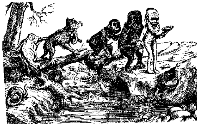
Die Angst viktorianischer Christen vor Darwins Theorie äußerte sich in solchen Karikaturen

sondern auch die humanistischen Wertvorstellungen von Aufklärung und Klassik. Geistig verunsichert, immer stärker vom erfolgsorientierten Denken bestimmt, sucht man um so krampfhafter den Schein zu wahren, die Fassade der Ehrbarkeit und Sittenstrenge. Körperliches und Triebhaftes werden verleugnet. Die Literatur muss sich dem Diktat einer engherzigen öffentlichen Prüderie unterwerfen.