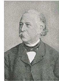
THEODOR FONTANE (1819-1898)

Das Programm des poetischen Realismus verlangt vom Autor eine doppelbödige Darstellung. Einerseits ist die alltägliche Welt genau, einfach und wiedererkennbar zu beschreiben, andererseits muss die Beschreibung auf die tiefere Wirklichkeit verweisen. Beiden Aufgaben sucht er dadurch zu genügen, dass er den alltäglichen Dingen und Vorgängen einen möglichst unauffälligen Symbolwert verleiht. Ein spannungsvolles Gleichgewicht zwischen realistischer und symbolischer Ebene kann sich so einstellen.