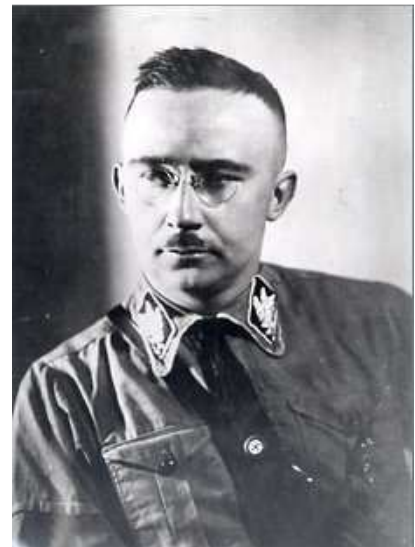
H. Himmler , seit 1927 „Stellvertretender Reichsführer – SS“, seit 1929 „ Reichsführer – SS “, 1934 von Hermann Göring zum „Stellvertretenden Chef und Inspekteur der Preußischen Geheimen Staatspolizei [Gestapo]“, seit 1943 Reichsinnenminister und seit 1944 Oberbefehlshaber über das Ersatzheer

den einzelnen Ländern ein. Die Reihenfolge vermag ich nicht mehr genau anzugeben. Zuerst sollte für Auschwitz Ostoberschlesien und die daran angrenzenden Teile des General-Gouvernements in Frage kommen. Gleichzeitig, und dann je nach Lage fortgesetzt, die Juden aus Deutschland und der Tschecho - Slowakei. Anschließend der Westen, Frankreich, Belgien, Holland. Er nannte mir auch ungefähre Zahlen der zu erwartenden Transporte, die ich aber nicht mehr nennen kann. Wir besprachen weiter die Durchführung der Vernichtung. Es käme nur Gas in Frage, denn durch Erschießen die zu erwartenden Massen zu beseitigen, wäre schlechterdings unmöglich und auch eine zu große Belastung für die SS-Männer, die dies durchführen müssten im Hinblick auf die Frauen und Kinder. Eichmann machte mich bekannt mit der Tötung durch die Motoren-Abgase in Lastwagen , wie sie bisher im Osten durchgeführt wurde. Dies käme aber für die zu erwartenden Massen-Transporte in Auschwitz nicht in Frage. Die Tötung durch Kohlenoxyd-Gas, durch Brausen in einem Baderaum , wie die Vernichtung der Geisteskranken an einigen Stellen im Reich durchgeführt wurde, erfordere zuviel Baulichkeiten, auch wäre die Beschaffung des Gases für die