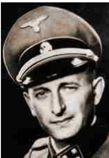
Eichmann, Adolf , dt. SS-Führer * 19.03.1906 Solingen † 01.06.1962 Ramleh/Israel (hingerichtet)

Nach Erhalt dieses schwerwiegenden Befehles fuhr ich sofort nach Auschwitz zurück, ohne mich bei meiner vorgesetzten Dienststelle in Oranienburg gemeldet zu haben. Kurze Zeit danach kam Eichmann zu mir nach Auschwitz . Er weihte mich in die Pläne der Aktionen in