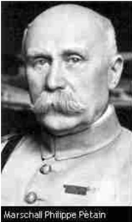
Marschall Philippe Pétain

überdies an einer - verlorengegangenen - Erzählung mit dem Titel „ Die weiße Hochzeit “ zu schreiben.